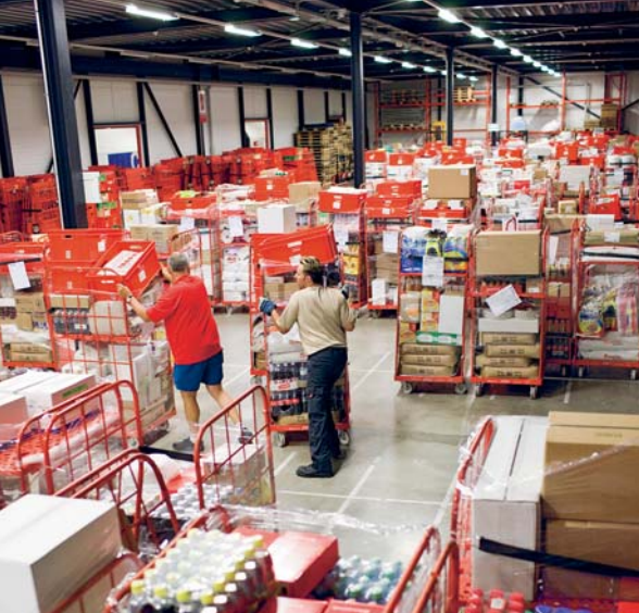
... Pistor à Chavornay et ...