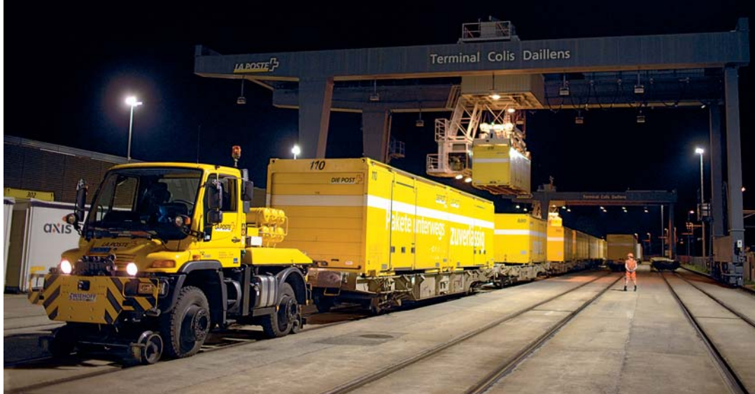
Trois entreprises qui gèrent leurs centres de distribution le long de l'Arc jurassien: la Poste à Daillens, ...

Très vite, cette première liaison transversale a pris de l'importance, tant dans le trafic de voyageurs que de marchandises. La topographie du pied sud du Jura, avec ses faibles dénivelés, est favorable au transport de marchandises par rail. Elle a donc contribué à l'essor économique de la Suisse, les principaux centres et régions économiques du pays se trouvant sur le Plateau, entre le lac de Constance et le lac Léman.