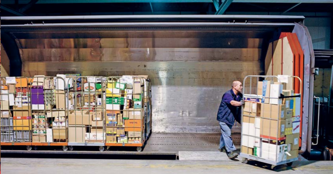
... Coop à Aclens (tous les trois dans le canton de Vaud).

SBB Cargo, relativise: «Les capacités sont suffisantes pour le volume de trafic actuel. Mais la ligne à une voie entre Douanne et Gléresse, le long du lac de Bière, limite notre développement.» Selon Büchi, alors que la situation s'est détendue pour le trafic de marchandises grâce à la nouvelle ligne jusqu'à Soleure, de petites perturbations entre Bière et Lausanne auraient déjà de graves conséquences sur l'horaire. L'élargissement à deux voies entre Douanne et Gléresse est prévu dans le projet «Rail 2030».