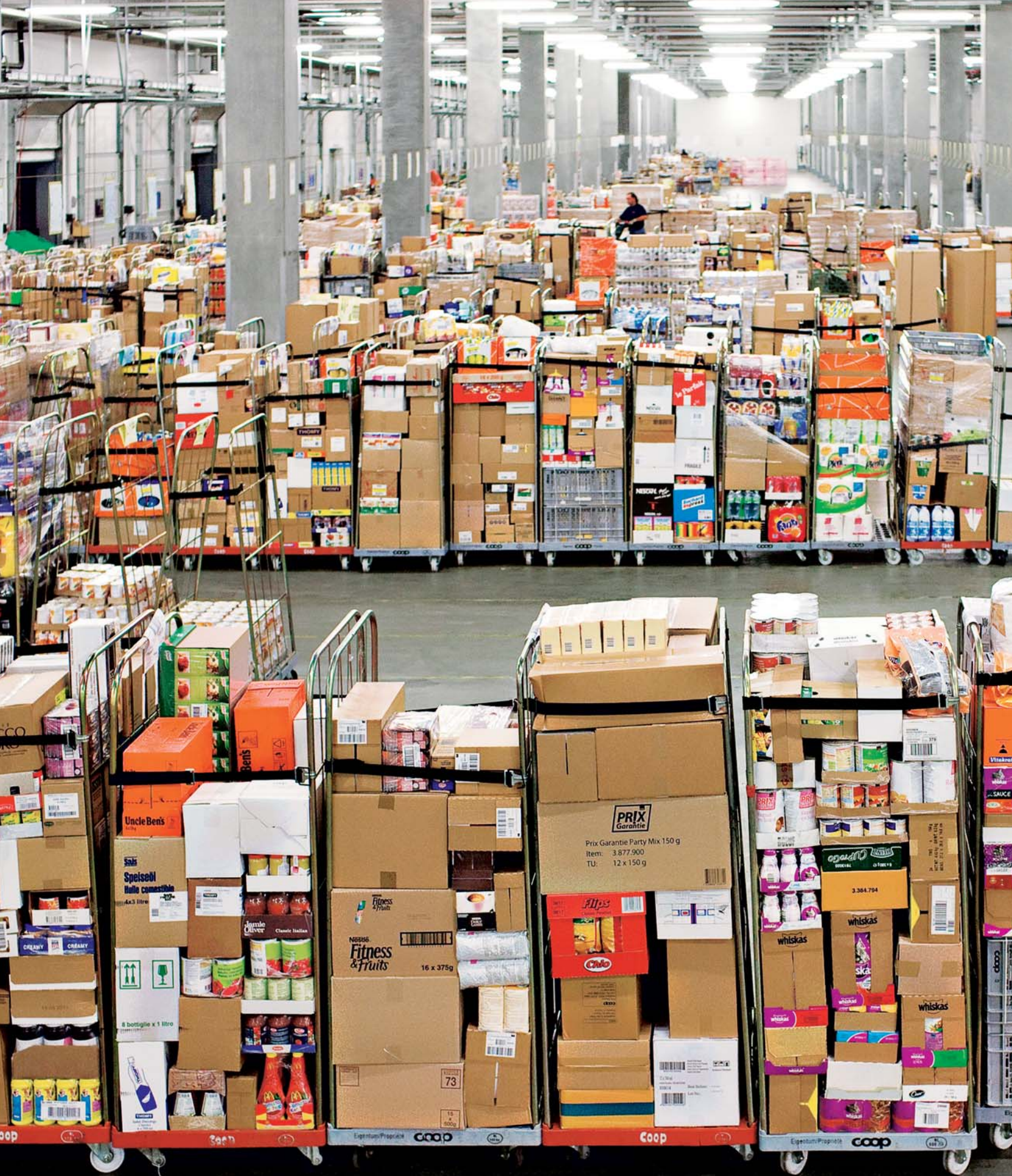
Centrale Coop à Aclens: c'est ici qu'arrivent tous les matins vers 4 h les wagons chargés de produits qui sont ensuite distribués dans les magasins de Suisse romande.