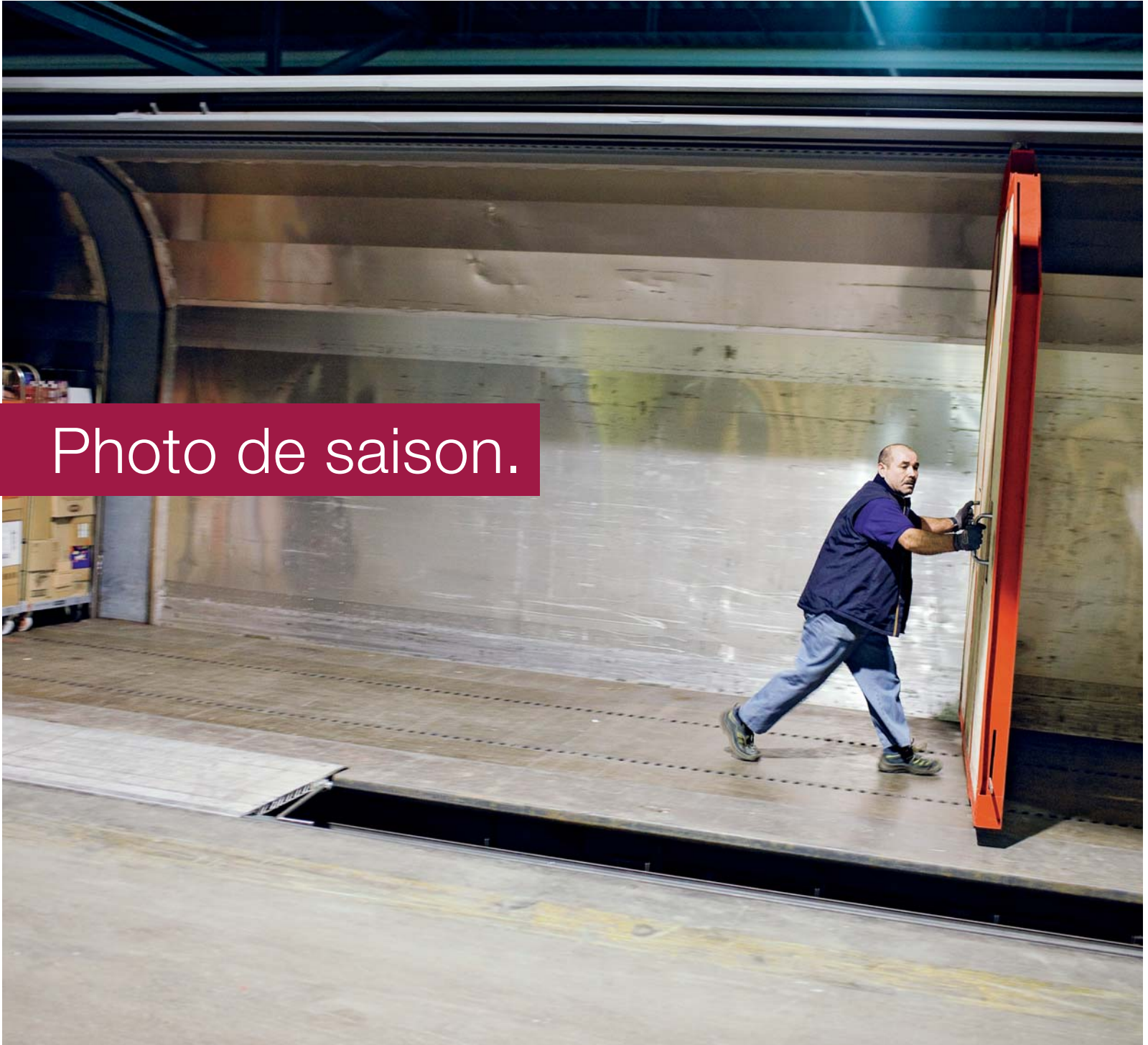
Photo de saison.