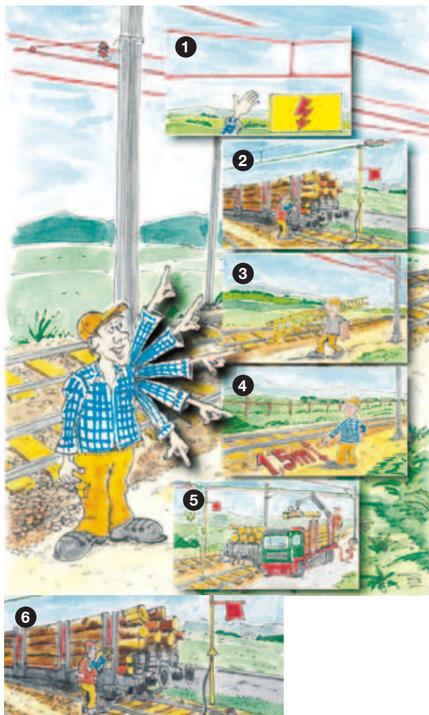
↑ Giubbotto protettivo con strisce catarifrangenti.

Ai fini della vostra sicurezza attenetevi alle presenti norme di comportamento.