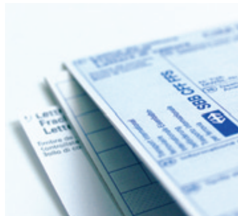
Mit dem vereinfachten Zollverfahren ist der CIM-Frachtbrief gleichzeitig Zolldokument.

Damit verringert sich der bürokratische Aufwand beim Grenzübertritt auf ein Minimum. Internationale Verkehre können noch zügiger abgewickelt werden. Der deutsche wie der italienische Zoll honorieren mit diesen Entscheidungen das «One-stop-shop»-Konzept von SBB Cargo samt Töchtern. Die Teilnahme am vgVV bedeutet für die Kunden von SBB Cargo eine wesentliche Vereinfachung der Zollformalitäten: Es müssen keine T-Versandanmeldungen mehr erstellt werden. Der internationale Frachtbrief CIM beziehungsweise der Übergabeschein TR für den kombinierten Verkehr dienen im vgVV zugleich als Zolldokumente. Weder beim Versand noch beim Grenzübertritt und beim Empfang kommt es wegen Zollformalitäten zu Verzögerungen.