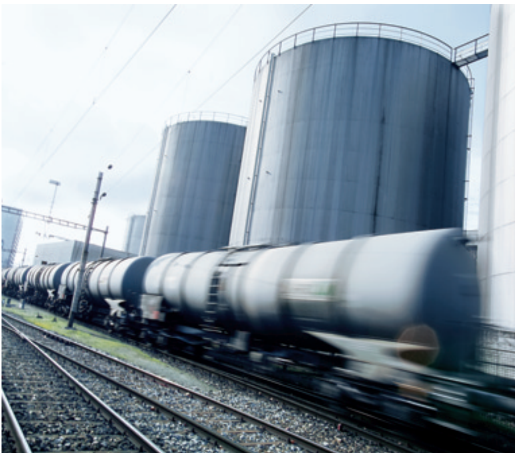
Im eigenen Zug: Migrol-Mineralöltransporte.

Der Visiteur übergibt dem Lokführer die Transportdokumente, darunter die Angaben über Zugnummer und Gewicht der Wagen. So kann dieser die Fahrgeschwindigkeit dem Bremsgewicht der Zugkomposition anpassen. Um 14.30 Uhr ist der Zug bereit und tritt seine zweistündige Fahrt nach Mellingen an. Dort werden die Wagen von der Lok abgehängt, rollen ins Empfangslager, wo sie am nächsten Tag entleert