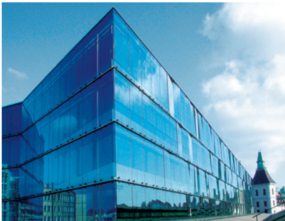
Hinter Glas: SBB Cargo-Zentrale am Basler Bahnhof.

Mehr Informationen unter ► www.sbbcargo.com/messe