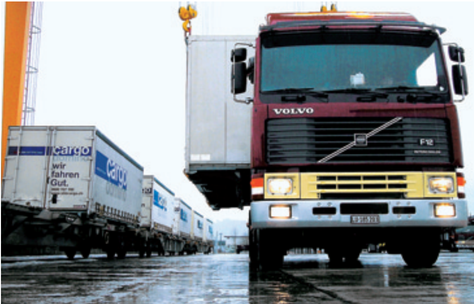
Stärkere Verlagerung auf die Schiene: Galliker in Altishofen.

form Boussens bei Lausanne, die keinen Bahnanschluss hat. Gerade dort wird die Ladung besonders früh benötigt. «SBB Cargo trug unseren Wünschen in puncto spätestmögliche Abholung in Altishofen dennoch Rechnung», lobt Galliker. «Behälter, die hier um 22 Uhr abgehen, treffen inklusive Lastwagennachlauf vom Bahnhof Renens bereits um 5.45 Uhr an unserer Plattform Boussens ein.» Demnach hat die Galliker Transport AG unter dem Strich 1¾ Stunden gegenüber direkt verkehrenden Lastwagen hereingeholt. Denn diese könnten wegen des Nachfahrverbots frühestens um 5 Uhr starten und – normale Strassenverhältnisse vorausge-