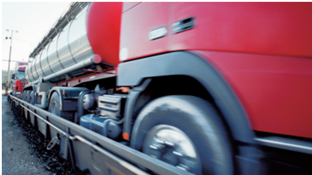
106 Züge wöchentlich zwischen Freiburg im Breisgau und Basel.

Die Firma Hupac hat letztes Jahr als erster Operateur in Europa die Transporte für ihr Leistungsangebot ausgeschrieben. Mehr als die Hälfte des ausgeschrieben Transitverkehrs durch die Schweiz hat SBB Cargo gewonnen. Als so genannte Hauptfrachtführerin trägt SBB